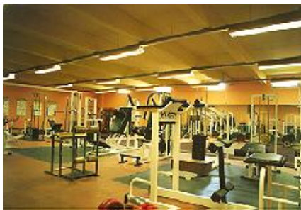
La salle de musculation