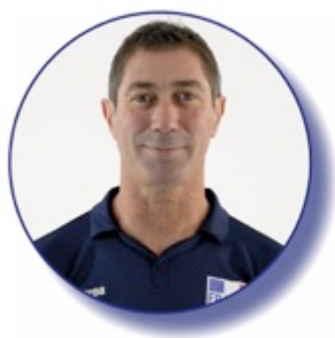
Laurent TILLIE Coach