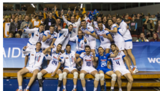
nombre de selections

En 2014, au Championnat du Monde, l'Italie terminera 13 ème et fera partie des 4 nations qui auront réussi à battre la France (lors de la première phase de poules)