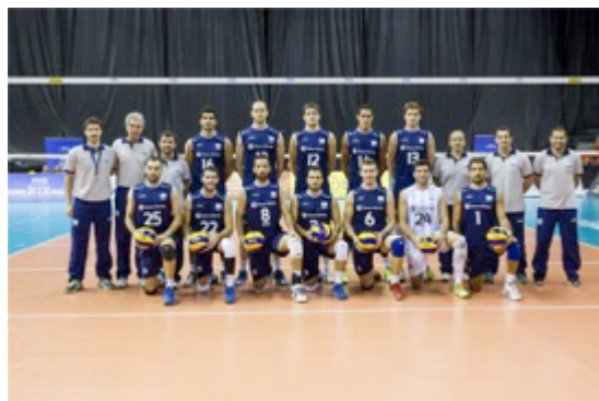
nombre de selections

Avec une équipe 6 ème au classement FIVB, Velasco ambitionne de grands succès avec sa sélection nationale, lui qui a eu une brillante carrière en tant que coach à l'étranger (Italie, République Tchèque, Espagne, Iran)