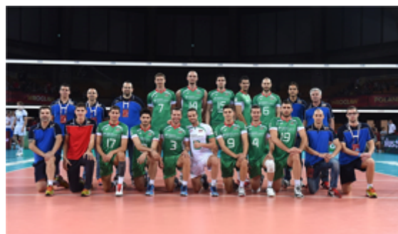
nombre de selections

Comme le prévoit la formule sportive de la compétition, ils sont donc descendus dans le groupe 2 pour la saison 2015. Organisateurs du Final 4, ils sont automatiquement qualifiés pour cette phase finale.