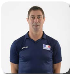
Laurent TILLIE Entraîneur